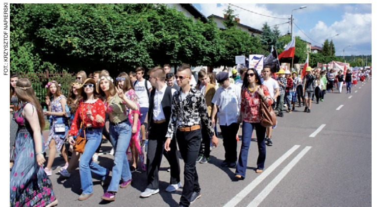
Ulicami miasta przeszedł barwny korowód Ku Niepodległej