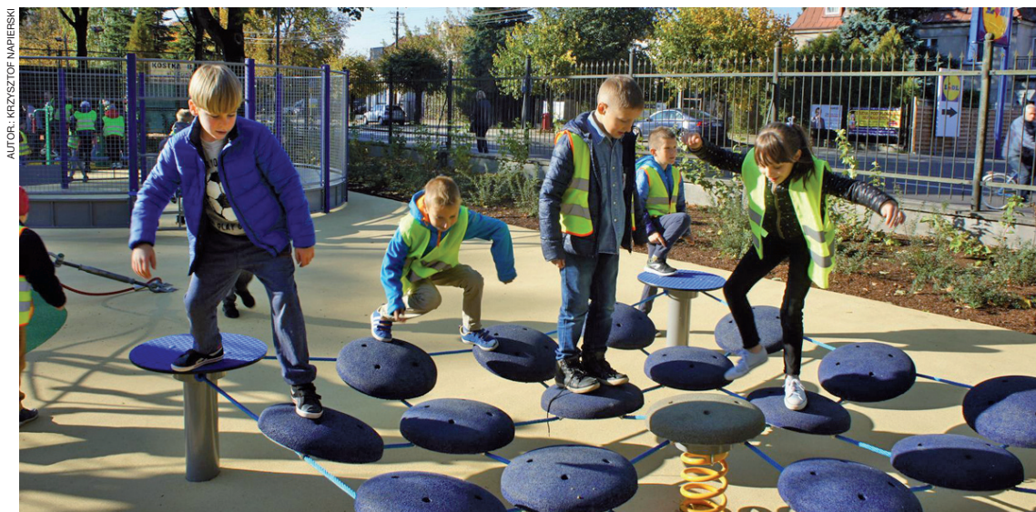
Nowy plac zabaw jest oblegany zarówno przez dzieci...