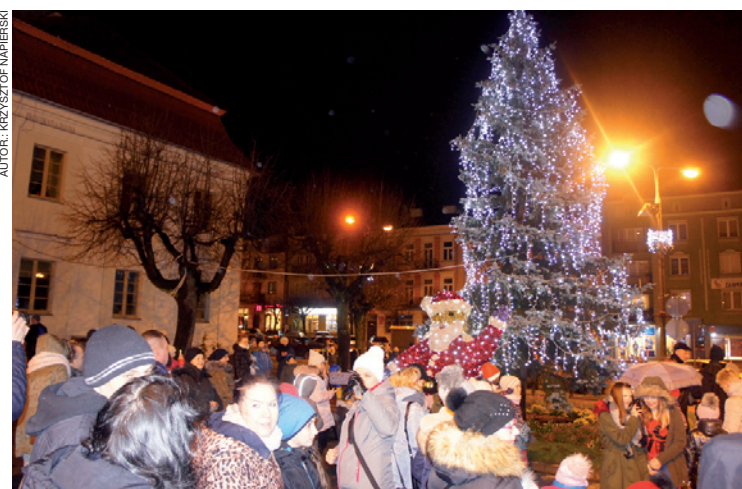
Mikołaj i świąteczna choinka przy mławskim ratuszu