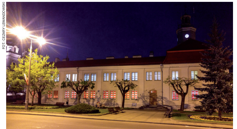
Okna mławskiego ratusza przybrały na początku maja barwy biało-czerwone