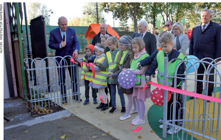
Uroczystego przecięcia wstęgi dokonali przyszli użytkownicy placu