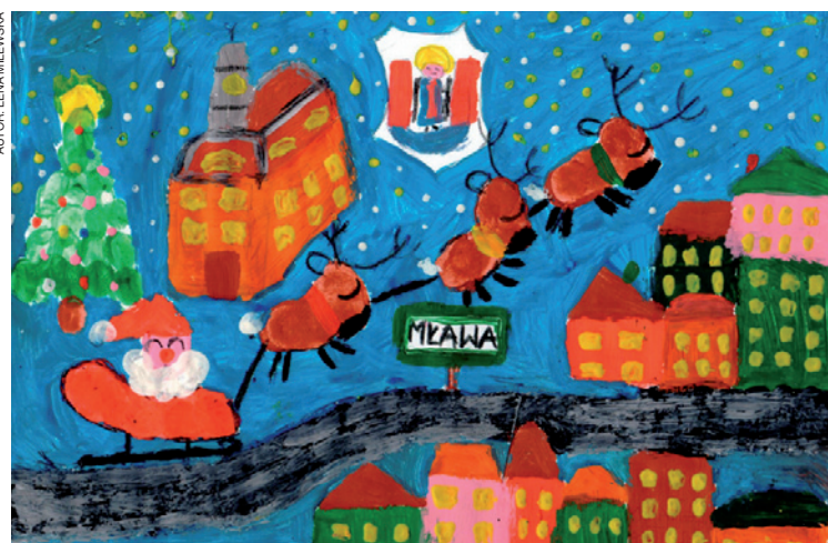
Kartka nagrodzona w poprzedniej edycji konkursu