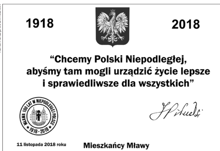
Tak wygląda projekt tablicy, która wkrótce zostanie odsłonięta

Zwienieniem tegorocznych obchodów setnej rocznicy odzyskania przez Polskę niepodległości będzie wmurowanie i odsłonięcie 11 listopada 2018 r. tablicy pamiątkowej.