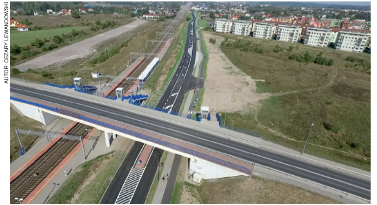
Aleja Świętego Wojciecha z lotu ptaka