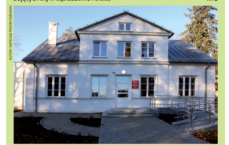
Urząd Stanu Cywilnego funkcjonuje już w Pałacu Ślubów

Na prace czekamy do 19 listopada. Więcej szczegółów na www.mlawa.pl