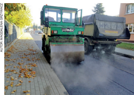
Ulica ks. Mariana Czapli ma już nową nawierzchnię

Poza remontami istniejących chodników wybudowaliśmy parking przed