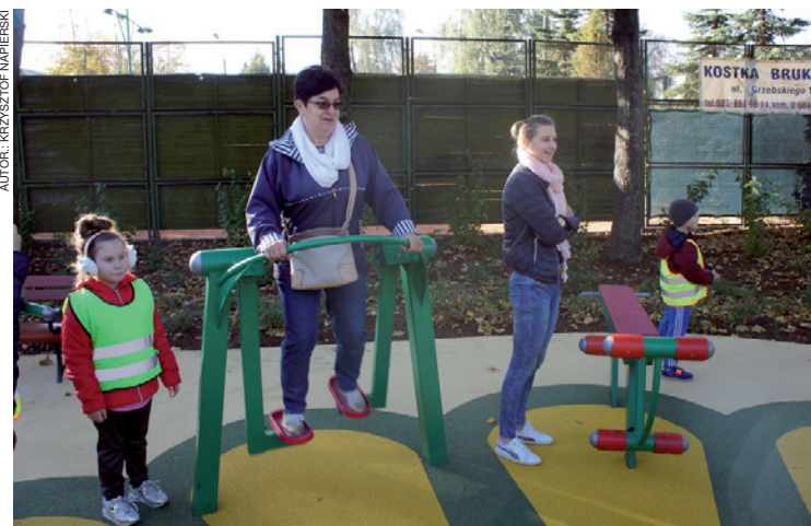
...jak i przez dorosłych amatorów rekreacji