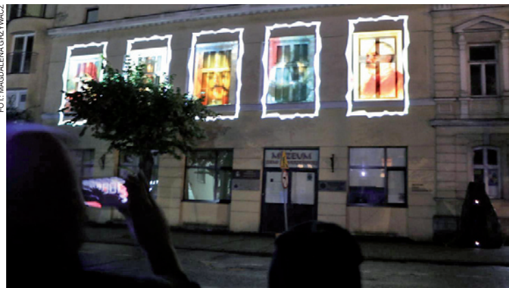
Na ścianach muzeum wyświetlono sceny z historii Polski i samej Mławy

Duży podziw wśród oglądających wzbudziła instalacja multimedialna „N100” wyświetlona 28 września na ścianach Muzeum Ziemi Zawkrzeńskiej. W oknach budynku pojawiały się postacie znane z obrazów będących w zbiorach placówki. Przed oczyma widzów przewijały się sceny zarówno radosnych, jak i tych bolesnych wydarzeń z historii Polski, Mławy oraz samego muzeum. Autorami animacji byli Krystian Batyjewski i Józef Żuk Piwkowski, natomiast towarzyszącą jej muzykę skomponował Miro Kepiński. Kilka miesięcy wcześniej, bo na początku maja, 100-lecie odzyskania niepodległości „uczcił” także budynek ratusza, którego okna na kilka dni przybrały barwy biały i czerwony (najbardziej efektownie wyglądał o zmroku).