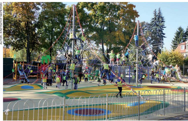
Największą atrakcją dla maluchów jest wielkie linarium