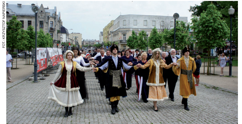
Mieszkańcy Mławy prowadzeni przez młodzież zatańczyli w parku poloneza