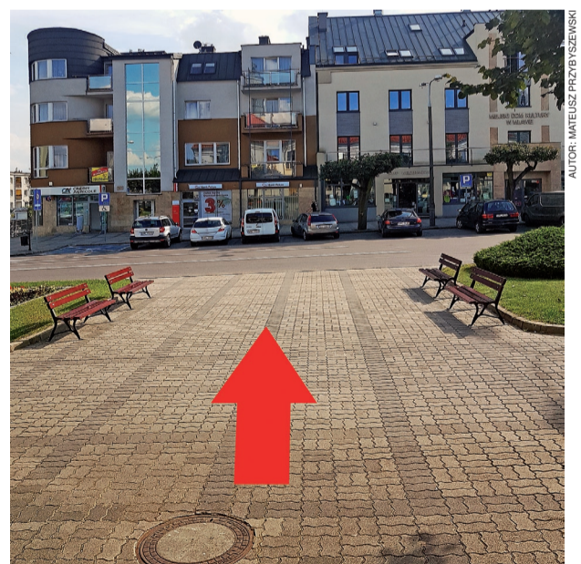
Dokładnie w tym miejscu stanie Ławka Niepodległości

Ławka Niepodległości to pomnik, który ma upamiętnić tradycję, historię i chwałę polskiego oręża oraz przypominać o odzyskanej równo sto lat temu, okupionej krwią i wywalczonej przez naszych przodków niepodległości. Umieszczenie ławki w naszym mieście jest rezultatem konkursu ogłoszonego przez Ministerstwo Obrony Narodowej pt. „Ławka Niepodległości dla samorządów”. Nasze miasto złożyło wniosek o dofinansowanie, który został oceniony pozytywnie i tym samym znaleźliśmy się w gronie 143 samorządów, którym przyznano dofinansowanie na postawienie ławki. Koszt realizacji tej inwestycji wynosi 37 500 zł, z czego 80 % kwoty (30 000 zł) stanowi dofinansowanie MON. Wokół ławki posadzone zostaną rośliny, a sama ław-