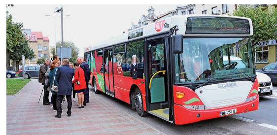
Pierwszy autobus w nowych barwach wyruszył w trasę 1 października