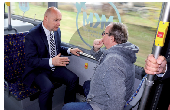
Przez cztery lata MKM-ką przejechało ponad milion pasażerów

Biuletyn przygotowany przez Urząd Miasta Mława.