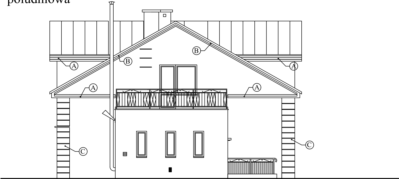
Elewacja boczna 1 południowa