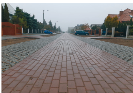
Ulica Leszczyńskiego już po remoncie

W ramach przebudowy wykonano obustronne chodniki o szerokości od 1,5 do 3 m ze zjazdami do posesji oraz drogę z kostki betonowej i płyt ażurowych o szerokości 6 m. Chodnik po prawej stronie, od ulicy Zachodniej, będzie miał charakter ciągu pieszo-jezdnego z możliwością poruszania się rowerami. Chodniki i droga są rozdzielone pasami zieleni, została wsiana trawa.