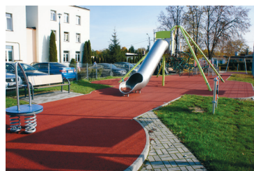
Plac zabaw przy Szkole Podstawowej nr 3 w Mławie

i zwiększy się komfort spędzania na nich czasu. Na placach zabaw wykonano nawierzchnie poliuretanowe w technologii dwuwarstwowej. KN