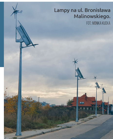
Lampy na ul. Bronistawa Malinowskiego.