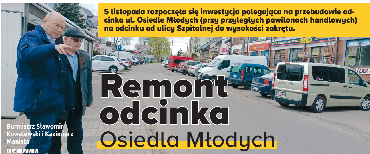
Burmistrz Sławomir Kowalewski i Kazimierz Manista

5 listopada rozpoczęła się inwestycja polegająca na przebudowie odcinka ul. Osiedle Młodych (przy przyległych pawilonach handlowych) na odcinku od ulicy Szpitalnej do wysokości zakrętu.