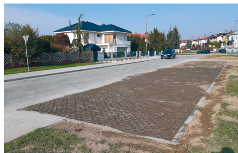
Plac od strony ulicy Łojewskiego