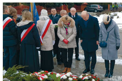
Pod kopcem Powstańców Styczniowych złożono kwiaty

22 stycznia obchodziliśmy 160. rocznicę Powstania Styczniowego. Związane z nią uroczystości rozpoczęła msza święta w kościele pw. Ducha Świętego, którą koncelebrował ks. kan. Sławomir Krasieński.