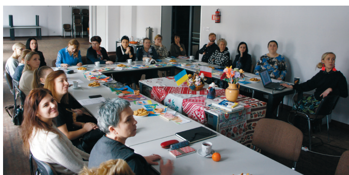
Spotkanie podsumowujące odbyło się 3 lutego