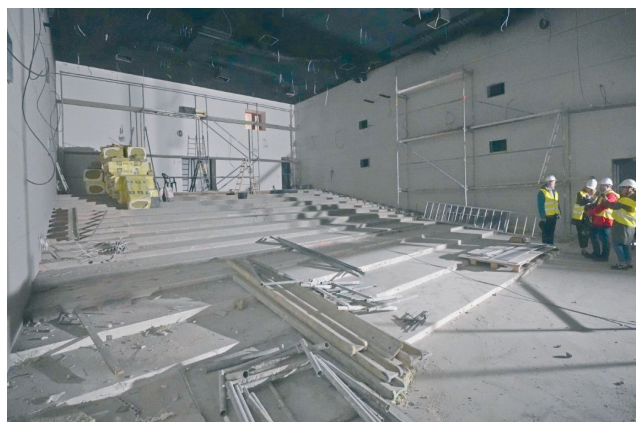
Sala kina jest przygotowywana do montażu sprzętu i foteli