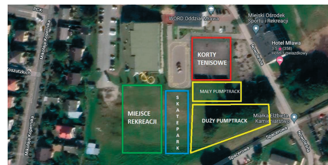
Koncepcja zagospodarowania terenu

Rada Miasta Mława na ostatniej sesji przyjęła propozycję burmistrza Sławomira Kowalewskiego i wprowadziła do budżetu środki na realizację inwestycji pn. Budowa pumptrack i skatepark na terenie MOSiR-u. Projekt zakłada budowę torów do jazdy rowerem oraz drugiego do jazdy na deskorolce i rolkach wraz z ogrodzeniem, oświetleniem, monitoringiem i zielonym placem rekreacji, wyposażonym w ławki i stojaki rowerowe. Obiekty mają być zlokalizowane tuż przy kortach tenisowych.