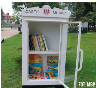
Biblioteczka stoi w parku miejskim, nieopodal Pałacu Ślubów

Wszyscy cieszymy się z białej biblioteczki na książki w parku. Chętnie częstujemy się pozostawionymi w niej lekturami, jednak rzadziej „uwalniamy” książki z własnych zbiorów. Zachęcamy do tego, bo biblioteczka i czytelnicy czekają na nowe pozycje, a także na... recenzje.