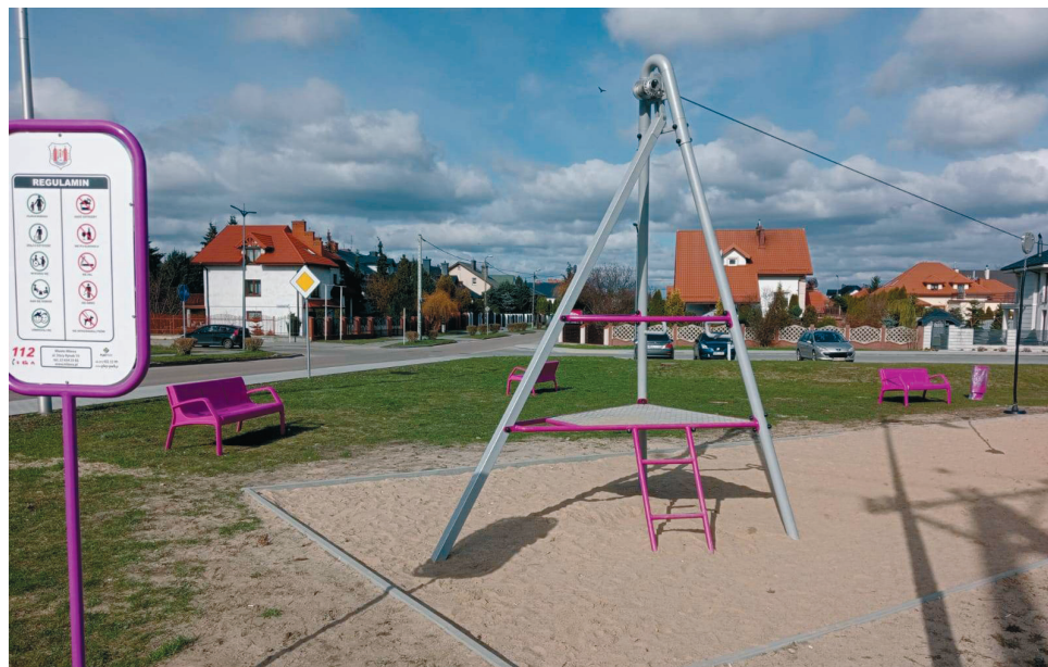
MG Niedługo skwer się zazieleni

Idąc za przykładem Żółtego Zakątka, temu na skrzyżowaniu Ciechanowskiej i Dobrowskiej nadaliśmy nazwę nawiązującą do dominandy różowego koloru. Jakie zakątki i gdzie powstaną jeszcze w Mławie? O tym napiszemy wkrótce.