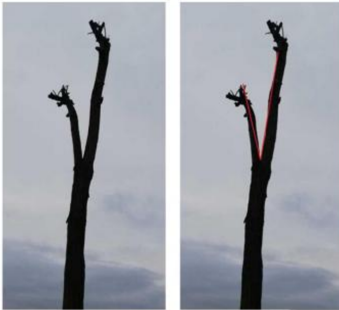
Jedyneczka z trojkątem